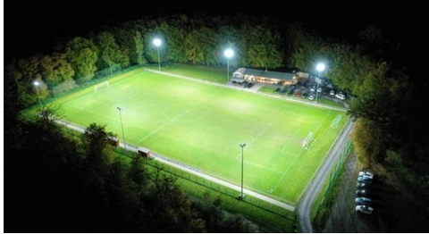
Sportplatz Niedershausen mit neuem Flutlicht